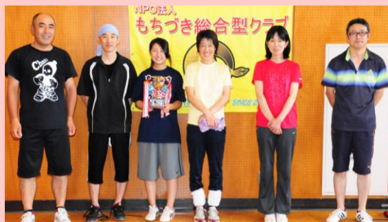
準優勝 「小平ファイターズ」